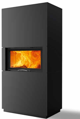
Rikk 75 Stahl