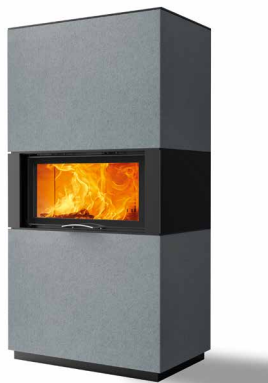
Rikk 75 Beton hell