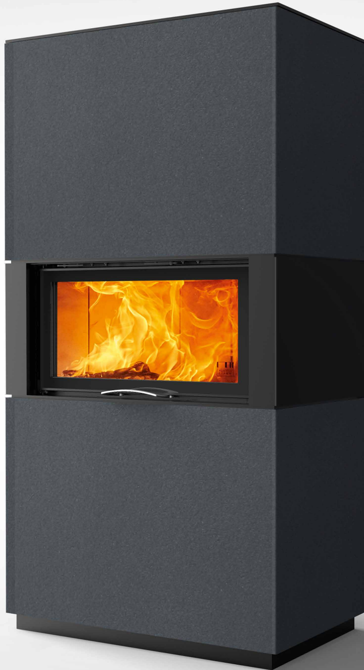
Rikk 75 Beton anthrazit