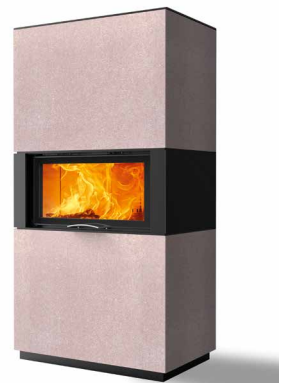
Rikk 75 Beton terra