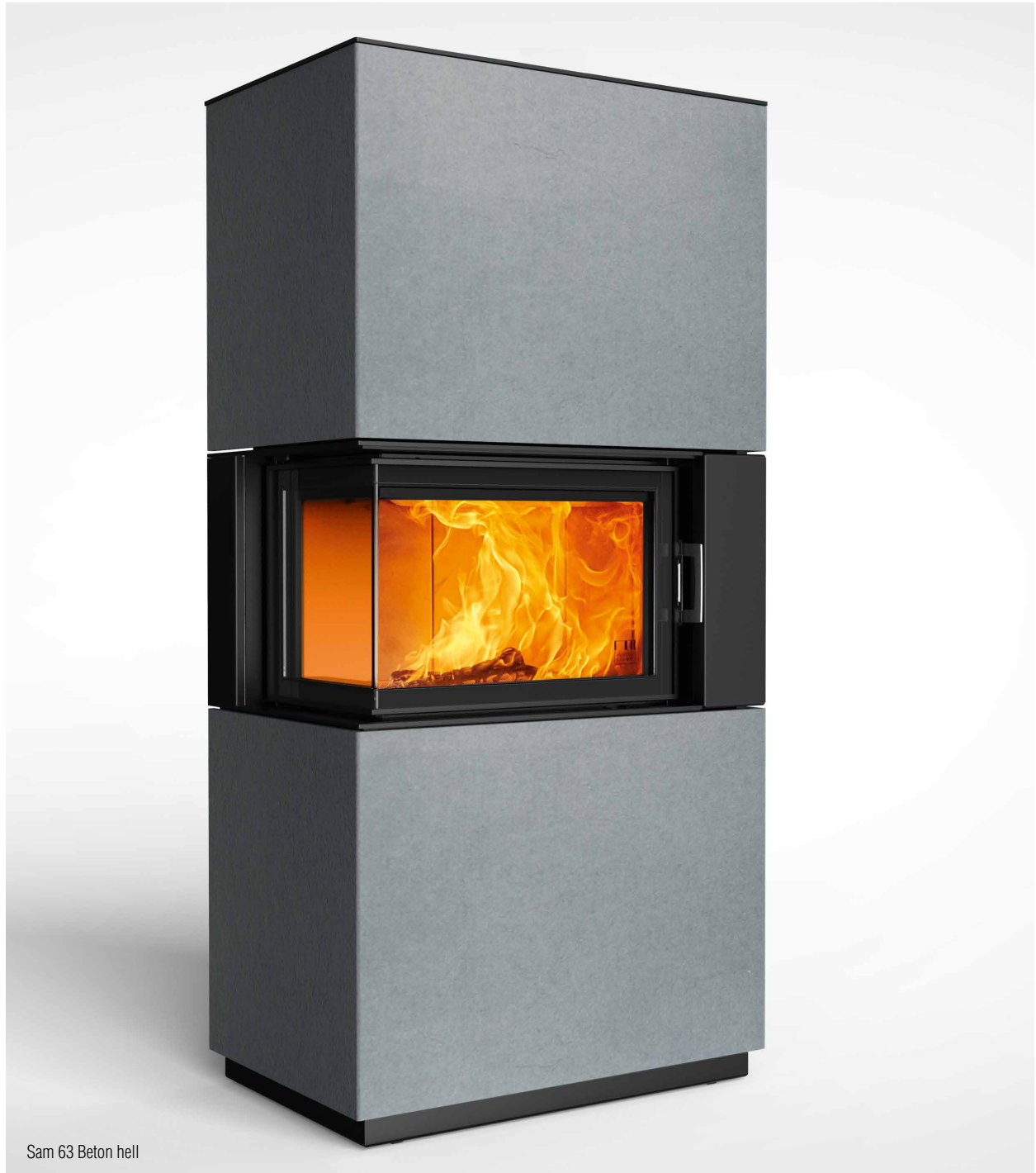
Sam 63 Beton hell