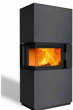
Sam 63 Beton anthrazit