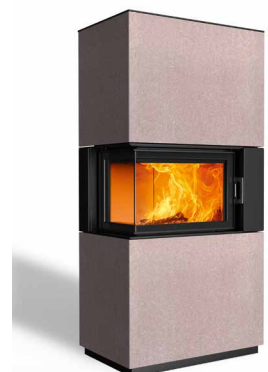
Sam 63 Beton terra