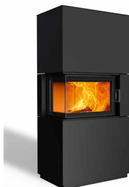
Sam 63 Stahl